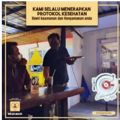
Gambar 11. Feed Instagram dengan tema informasi protokol kesehatan