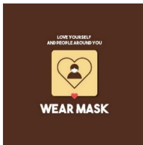
Gambar 3. Tagline “Love Yourself And People Around You, Wear Mask”

menerapkan protokol kesehatan di Lokananta Teras Cafe. Tagline yang digunakan adalah sebuah kalimat yang berhubungan dengan penerapan protokol kesehatan pada masa pandemic Covid 19 di Lokananta Teras Cafe, bertuliskan: “Love yourself and people around you, wear mask” . Yang artinya “Cintailah dirimu dan orang-orang disekitarmu, pakailah masker”