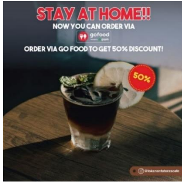
Gambar 10. Feed Instagram dengan tema promosi makanan