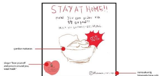
Gambar 5. Proses rough layout

Kemudian dilanjutkan dengan proses rough layout dan comprehensive layout dimana penulis mulai membuat rancangan kasar hingga rancangan lengkap, menggunakan tools yang ada di adobe illustrator.