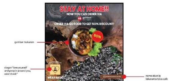
Gambar 8. Final Design Sumber: Dokumentasi Pribadi

Setelah selesai melakukan editing foto di adobe photoshop penulis melanjutkan pembuatan karya di adobe illustrator. Penulis membuat beberapa elemen desain dan pemilihan font untuk digunakan pada desain feed instagram, seperti teks pendek pelengkap informasi, label diskon, frame , dan lain-lain. Setelah elemen-elemen desain selesai dibuat, kemudian tibalah di tahapan final design , dimana penulis menggabungkan elemen-elemen desain tersebut dengan foto yang sudah edit, untuk dijadikan sebuah feed Instagram.