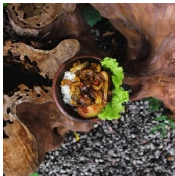
Gambar 7. Hasil editing foto objek makanan dan minuman dengan Adobe Photoshop

Setelah selesai melakukan editing foto di adobe photoshop penulis melanjutkan pembuatan karya di adobe illustrator. Penulis membuat beberapa elemen desain dan pemilihan font untuk digunakan pada desain feed instagram, seperti teks pendek pelengkap informasi, label diskon, frame , dan lain-lain. Setelah elemen-elemen desain selesai dibuat, kemudian tibalah di tahapan final design , dimana penulis menggabungkan elemen-elemen desain tersebut dengan foto yang sudah edit, untuk dijadikan sebuah feed Instagram.