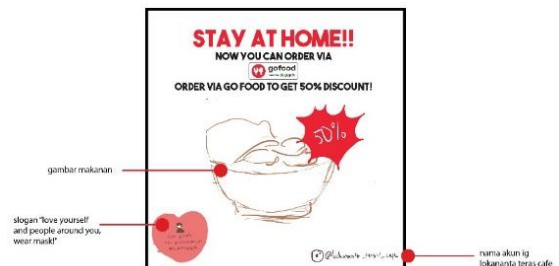
Gambar 6. Proses comprehensive layout

Kemudian penulis mengambil beberapa foto secara manual menggunakan kamera smartphone ketika melakukan observasi ke Lokananta Teras Cafe, untuk dijadikan salah satu elemen desain pada feed instagram. Setelah itu penulis menggunakan software adobe photoshop untuk melakukan editing pada foto-foto yang sudah diambil. Unsur