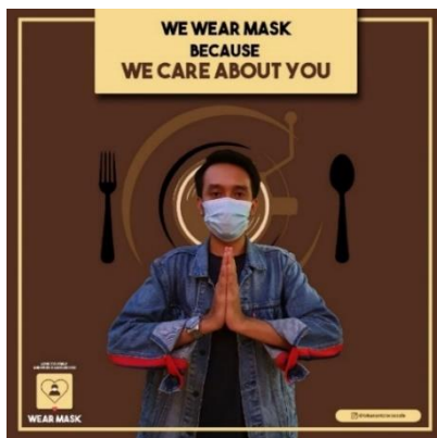
Gambar 12. Feed Instagram dengan tema informasi protokol kesehatan