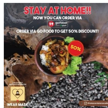
Gambar 9. Feed Instagram dengan tema promosi makanan