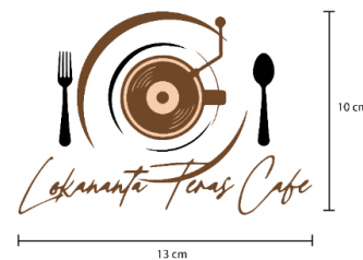
Gambar 2. Logo Lokananta Teras Café

Warna coklat, krem, dan hitam merupakan identitas visual dari Lokananta Teras Café yang dapat juga dilihat pada logo. Warna ini dipilih karena merepre-sentasikan tema Lokananta Teras Café yaitu vintage. Maka dari itu warna-warna tersebut menjadi warna kunci ( key color ) dan dapat diaplikasikan pada setiap desain.