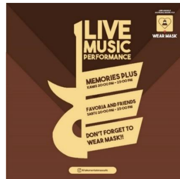
Gambar 14. Feed Instagram dengan tema promosi live music