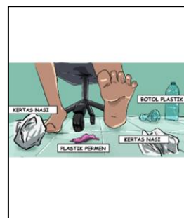
Gambar 9. Unsur atraktif kotak kata muncul secara bergantian (bag.2)