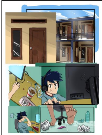
Gambar 3. Tampilan panel pertama

oleh para mahasiswa. Karakter utama dalam motion comic ini sendiri bernama Vadel, seorang mahasiswa berumur 21 tahun. Latar waktu terjadi pada Minggu pagi saat Vadel sedang bersantai di kamar kosnya sambil bermain gim komputer.