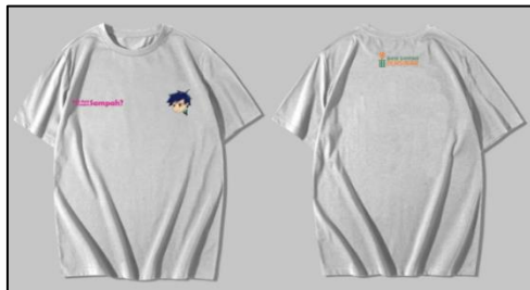
Gambar 12. Merchandise kaus