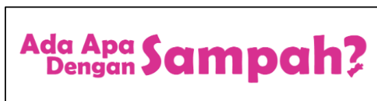
Gambar 1. Judul motion comic

Judul dari motion comic yang dibuat adalah "Ada Apa dengan Sampah?". Konsep dari judul tersebut merupakan hasil parodi judul dari sebuah intellectual property film yang sudah besar di Indonesia yakni "Ada Apa dengan Cinta?" yang fenomenal pada 2002. Alasan pengambilan keputusan itu adalah supaya dapat memberikan familiarity saat promosi dari motion comic ini dilakukan.