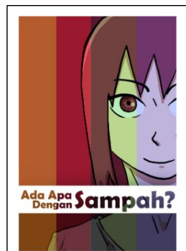
Gambar 2. Tampilan poster awareness