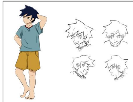
Gambar 4. Karakter Vadel

Vadel merupakan seorang mahasiswa berumur 21 Tahun, memiliki hobi bermain gim komputer, dan memiliki kebiasaan buruk selalu membuang sampah secara sembarangan di kamarnya sendiri. Pada akhirnya Vadel dapat memahami bahwa kebiasaannya itu tidak normal bagi orang lain.