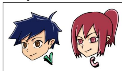
Gambar 10. Merchandise stiker

Pembuatan motion comic “Ada Apa dengan Sampah?” merupakan proyek yang diharapkan dapat direalisasikan dan memberikan impact yang diinginkan. Perancangan merchandise merupakan salah satu media promosi fisik untuk memperkuat branding dari proyek edukasi tentang pengelolaan sampah kepada Generasi Z ini. Merchandise yang dibuat merupakan produk yang dapat dipakai sehari-hari oleh generasi Z ataupun masyarakat umum. Jenis merchandise yang dipilih antara lain: stickers , baju kaus, dan tote-bag .