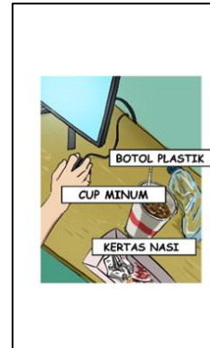
Gambar 8. Unsur atraktif kotak kata muncul secara bergantian (bag.1)

Selain itu, pada beberapa panel digunakan teknik yang memisahkan karakter dengan background sehingga memberikan ilusi ruang 3D. Ilusi 3D ini semakin terasa dengan cara menggerakkan background dan karakter dengan kecepatan yang berbeda. Kotak kata juga digunakan untuk memberikan keterangan mengenai objek yang ada di layar. Hal ini dilakukan untuk memberikan penekanan bahwa di dalam kamar kos Vadel terdapat banyak sampah.