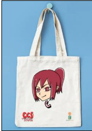
Gambar 11. Merchandise totebag