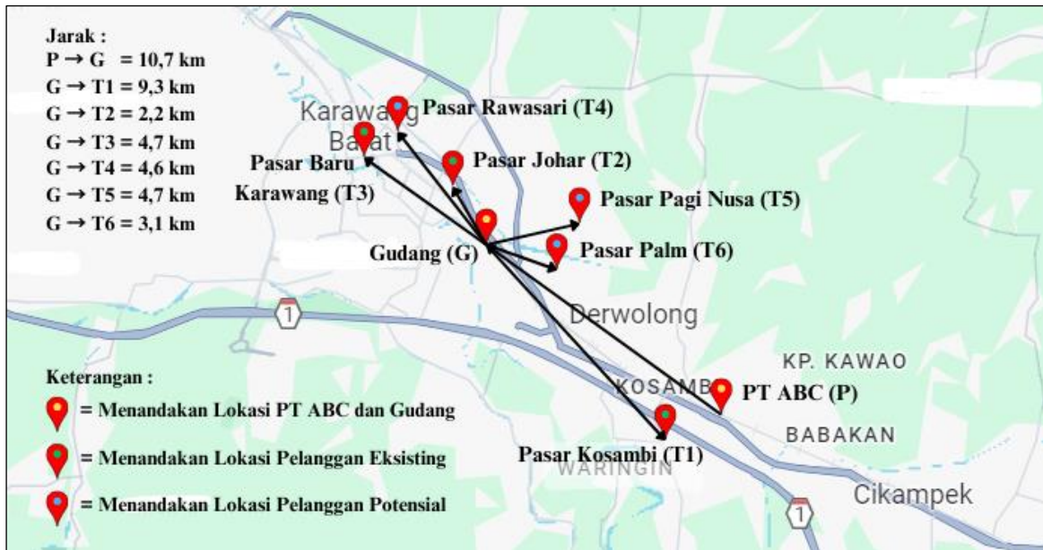
Gambar 3 Lokasi Gudang Usulan dan Pelanggan