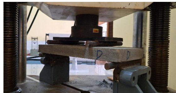
Gambar 4. Pengujian Kuat Lentur Panel Dinding