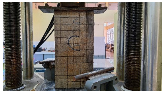
Gambar 2. Pengujian Kuat Tekan Panel Dinding

Pengujian kuat tekan dilakukan pada dua jenis panel dinding, yaitu panel dinding fly ash dengan tambahan limbah baja dan panel dinding fly ash tanpa limbah baja.