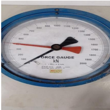
Gambar 3. Nilai Hasil Uji Kuat Tekan

penelitian sebelumnya yang dilakukan (Kejela, 2020), (Ahmad, et al., 2013) dan (Balwaik & Raut, 2014) pada variasi 15% mengalami penurunan kuat tekan dibawah rencana dikarenakan penelitian sebelumnya tidak menggunakan aktifator sehingga dapat mempengaruhi nilai kuat tekan. Aktifator NaOH 4 Mol dapat meningkatkan reaktivitas abu kertas.