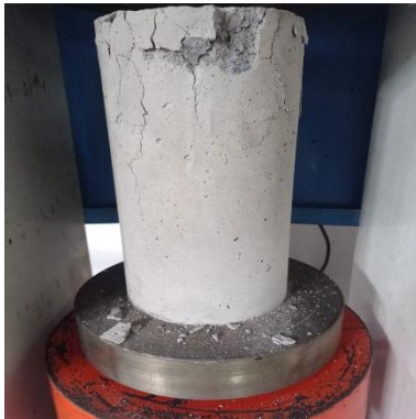
Gambar 4. Beton Hasil Uji Kuat Tekan