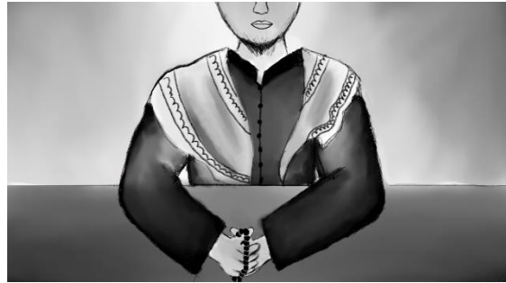
Gambar 18. Ustadz dan Lukisan yang Didoakan II