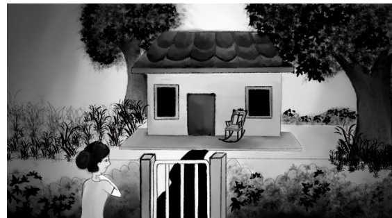
Gambar 12. Rumah Akmal

Tetangga yang melihat rumahnya Akmal terasa angker dan merinding