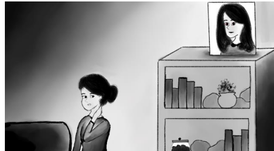
Gambar 11. Ibu Merinding