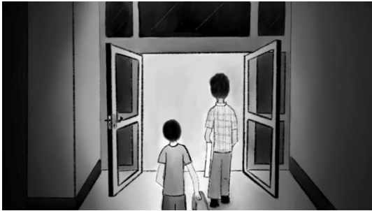
Gambar 7. Dosen dan Akmal Berbincang (Bagian 1)