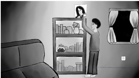
Gambar 9. Akmal Menaruh Lukisan

Akmal menaruh lukisannya diatas lemari dirumahnya