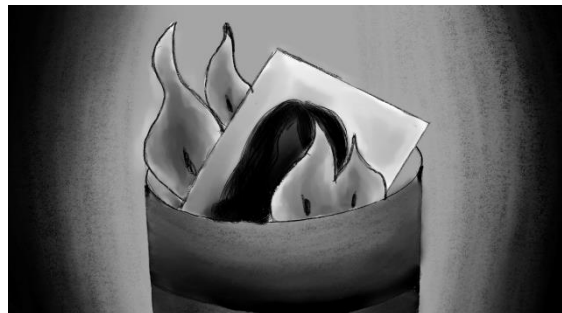
Gambar 19. Lukisan yang Dibakar

Konsep ilustrasi yang digunakan adalah ilustrasi semi realis dengan menggunakan warna hitam, putih, dan merah. Terdapat naskah dari perancangan ilustrasi ini yaitu : Nami abdi