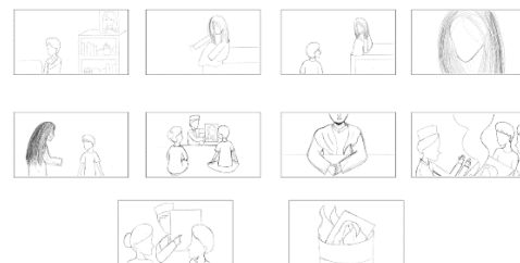
Gambar 21. Story Board II

Media Perancangan yang digunakan adalah Pro Create, Adobe Illustrator, dan Adobe Premiere.