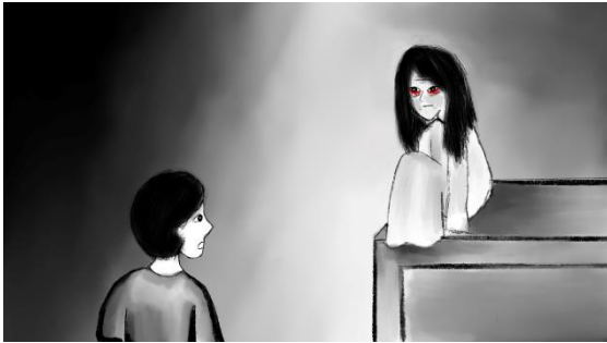
Gambar 14. Makhluk dan Lemari