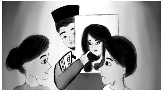
Gambar 18. Roh dan Lukisan yang Sudah Tidak Ada Jinnya

Lukisan yang sudah tidak ada jinnya dipegang pak ustadz, saya dan ibu melihatnya lukisannya emang berbeda dari yang sebelumnya