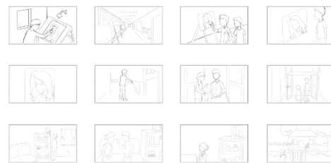
Gambar 20. Story Board I