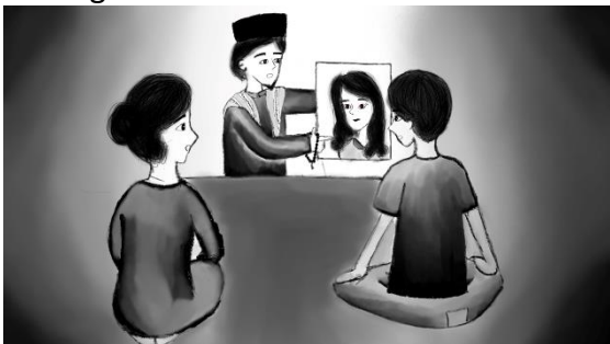
Gambar 17. Ustadz dan Lukisan

Ustadz, ibu, Akmal dan lukisannya yang sedang didoakan