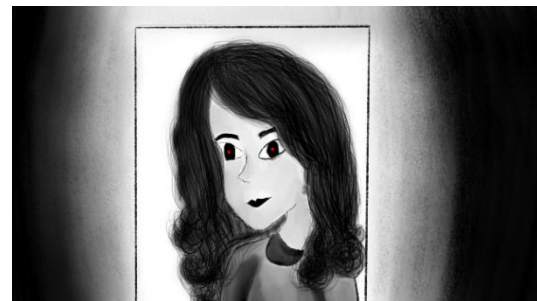
Gambar 5. Lukisan Bermata Merah

Zoom lukisan yang matanya terlihat tajam