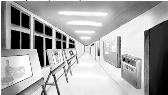
Gambar 2. Gallery Kampus Widyatama